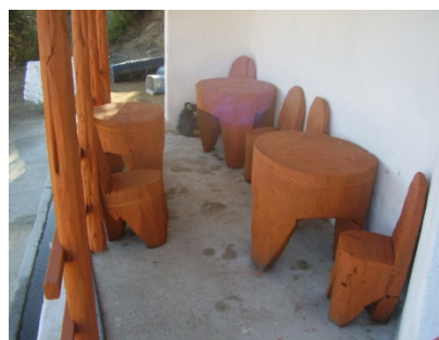
Εικόνες 5 και 6: Η κρήνη στην τοποθεσία «na karmilana» και ο χώρος αναψυχής